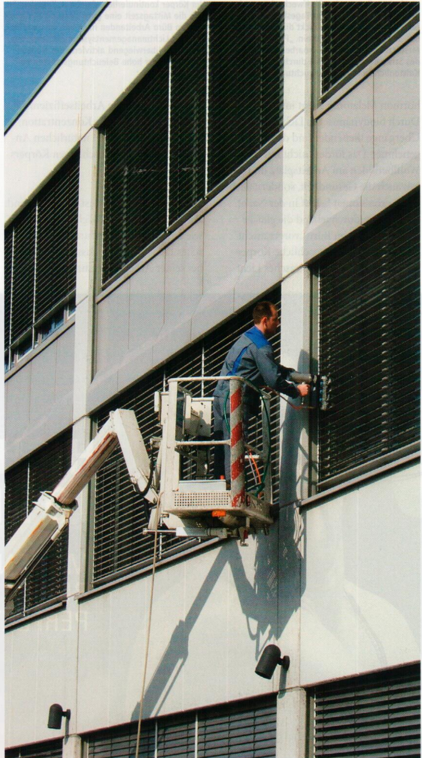
Außenjalousienreinigung direkt am Gebäude

Lange Zeit wurde zum Beispiel die Ultraschallreinigung als die Methode propagiert, mit der man so gut wie alle Sonnenschutzsysteme reinigen kann. Dabei kann gerade die Ultraschallreinigung zum Problem werden, da der Ultraschall nicht zwischen Verschmutzung, Beschichtung und Material unterscheiden kann, sondern alle Komponenten gleichzeitig versucht zu entfernen. Sind in der Beschichtung nur kleinste Risse oder Kratzer, kann die Ultraschallreinigung die komplette Beschichtung ablösen. Dem Gebäudereiniger bleibt dann nichts anderes übrig, als den beschädigten Sonnenschutz zu ersetzen. Auch die Reinigung mit dem Hochdruckreiniger verursacht häufig Schäden. Immer wieder kommt es zu Reklamationen, da versucht wurde, Außenjalousien direkt am Gebäude mit einem Hochdruckreiniger zu reinigen. Die Folge ist häufig ein Knicken oder Verbiegen der einzelnen Lamellen. Abgesehen davon, ist das Reinigungsergebnis bei stark verschmutzten Außenjalousien mit dem Hochdruckreiniger in den meisten Fällen unbefriedigend. Der Schmutzfilm bleibt, trotz Einsatz von Chemie und Wasserdruck, auf